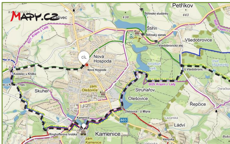
Krajinou barona Ringhoffera II, III