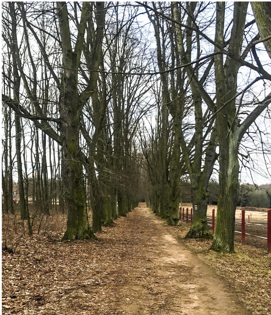
Ringhofferové nechali vysadit řadu alejí, tato vede k jejich rodinné hrobce u Kamenice