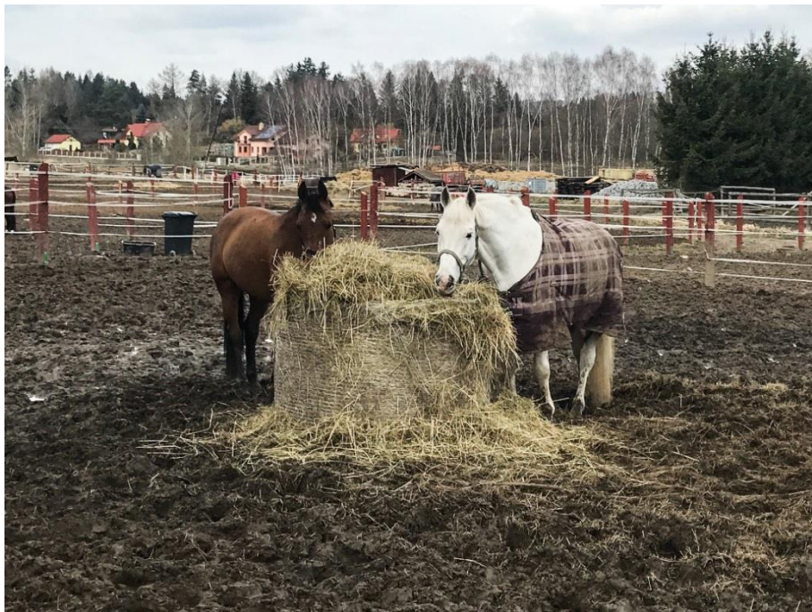
Původně měděný hamr rodu Ringhofferů, dnes stáje Kamenický dvůr

Pokud si budete chtít prohlédnout zámek Štířín, musíte sejít z Naučné stezky na rozcestí „U Všedobrovic“ a vydat se po zelené. Žádná velká zacházka to není a určitě se vám bude líbit v zámeckém parku.