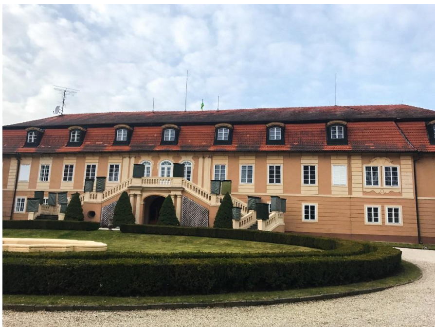
Nádvorbí barokního zámku Štířín